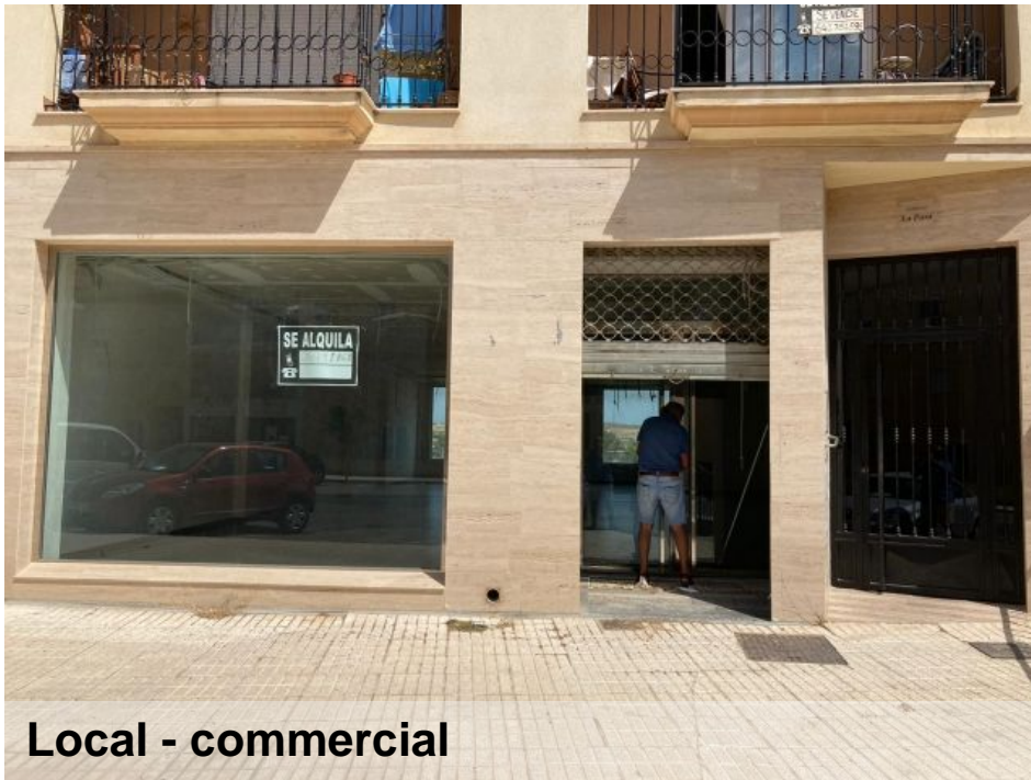
Local - commercial